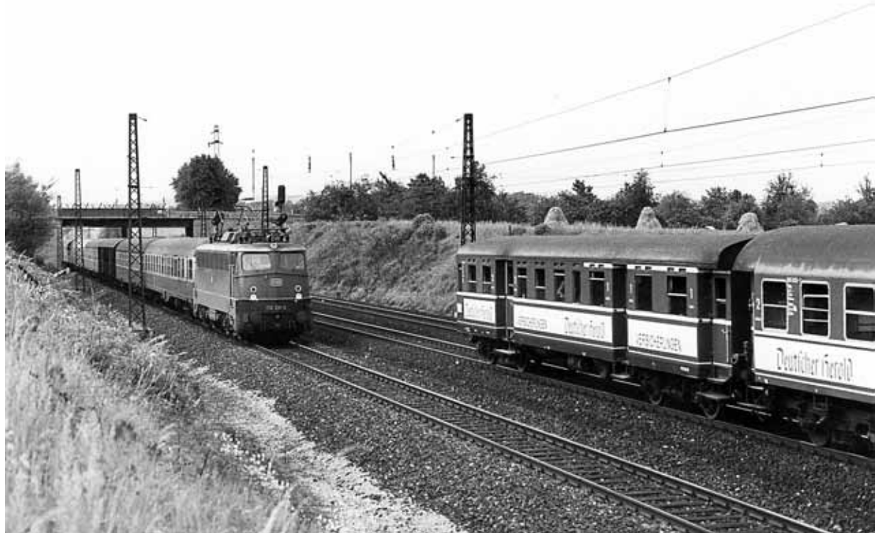
Aufnahme (2. Juni 1978): Michael Waidelich

Zugbegegnung bei Bietigheim (KBS 770). 110 391 (Krauss-Maffei 19166/1965) auf dem Weg nach Stuttgart begegnet einem 465er des Nahverkehrs Stuttgart - Bietigheim.