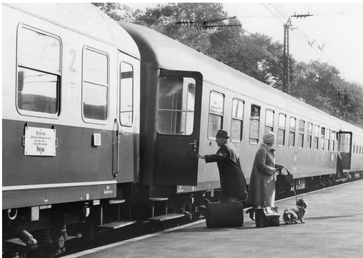
Aufnahme (1. Oktober 1979): Berthold Miß

Nicht (mehr) mit Kind und Kegel, dafür aber mit dem Dackel! Die niedrigen Bahnsteige machen das Aussteigen in Remagen aus dem Express aus Hoekvan-Holland für das ältere Ehepaar sicher nicht leichter.