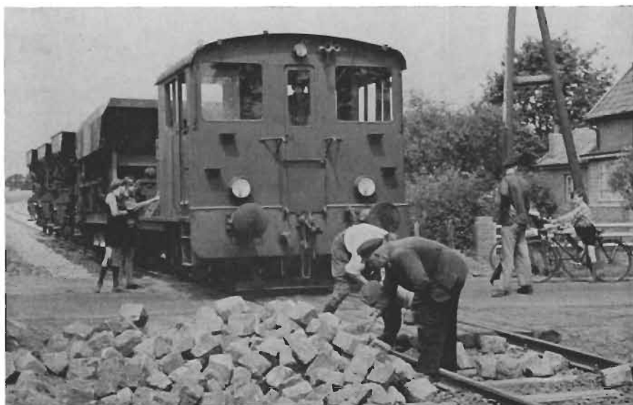
Bauzug am Bahnübergang Ohechausee in Garstedt. AKN, V 11, 27. 6. 1952